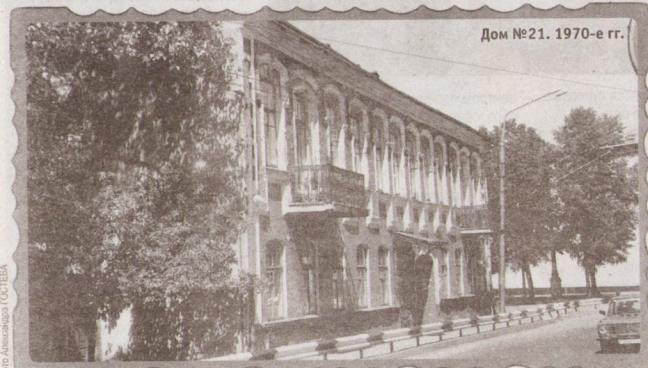
Дом №21. 1970-е гг.