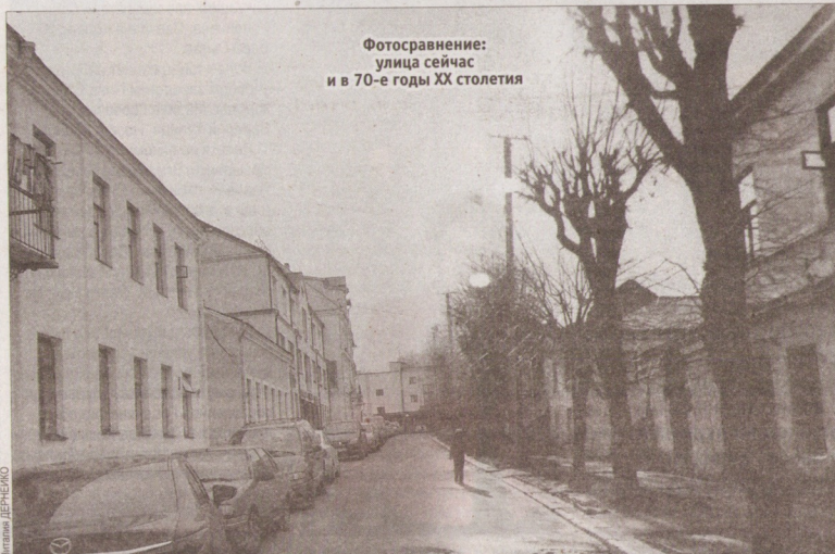
Фотосравнение: улица сейчас и в 70-е годы XX столетия

Она – одна из немногих улиц, сохранившая свое название, известное с XVI века. И хотя по продолжительности она небольшая, история, связанная с ней, несет в себе много новых и интересных фактов. Например, знаете ли вы, кто такой Калючина? Где советские дети постигали нотную грамоту и учились будущие раввины Израиля и Тель-Авива?